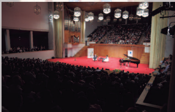
Charla de Mario Vargas Llosa en el Auditorio Manuel de Falla (FIP 2011).

La Tertulia. Calle Pintor López Mezquita, 3.